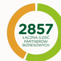
Monitoring Partnerów Biznesowych

Hochland Polska poddał analizie 2857 dostawców. Ryzyko oceniono na małe i średnie zgodnie z poniższymi grafikami: